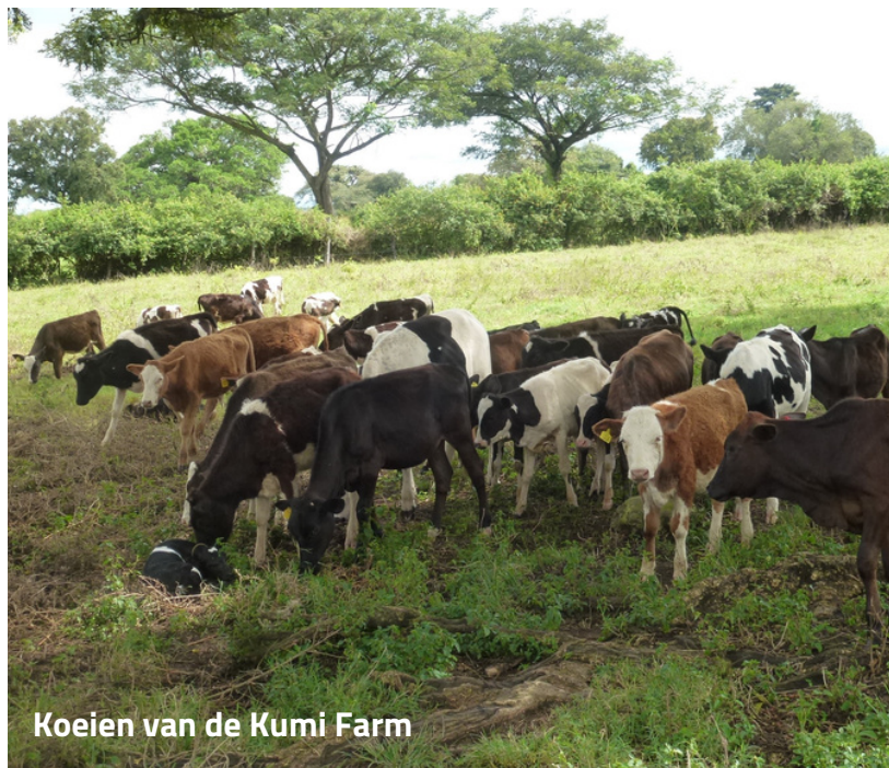
Koeien van de Kumi Farm