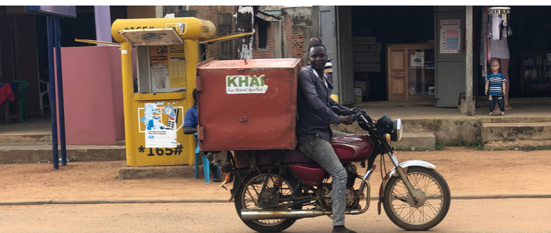
Dit is de brommer waarmee de bezorger elke dag het brood rondbrengt.