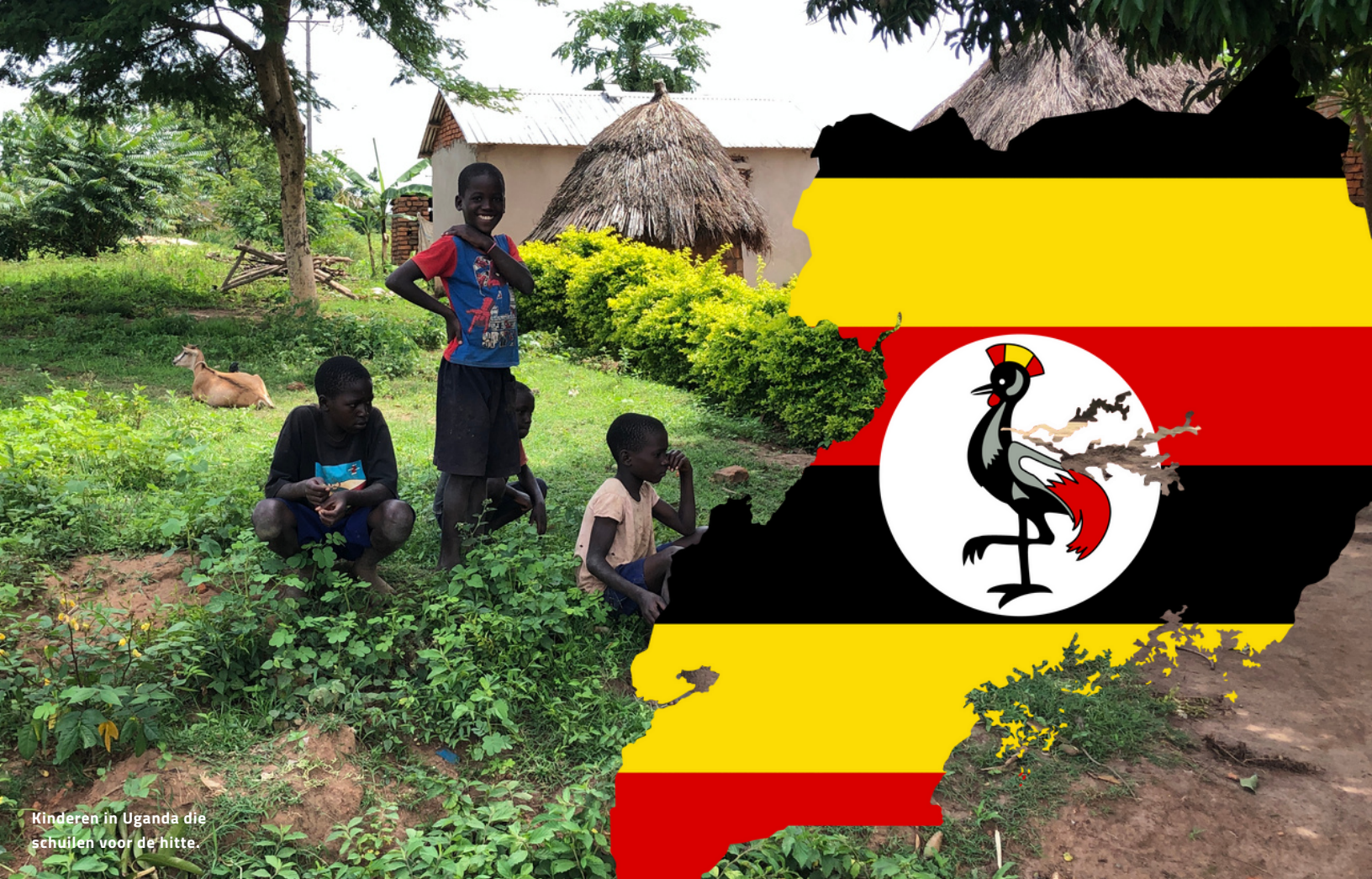
Kinderen in Uganda die schuilen voor de hitte.