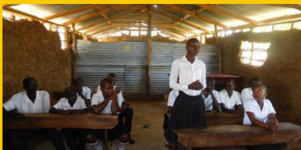
Afbeelding: Een leerlinge vertelt haar verhaal in de klas

Child Care Africa (CCA) biedt kwetsbare kinderen en jongeren in Afrika een beter toekomstperspectief door toegang tot onderwijs, gezondheidszorg, veiligheid en goede begeleiding te realiseren. Child Care Africa werkt met lokale partners in de Karamoja regio. Daar helpen zij door middel van hun scholarship programma inmiddels 188 leerlingen. Van Dorp foundation ondersteunt dit project en doneert € 10.000,- in 2021. Daarmee kunnen kinderen naar school, kunnen daarmee uit armoede ontsnappen, zodat zij een toekomst krijgen met kansen.