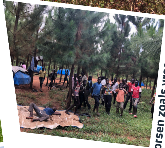
Dorsen zoals vroeger