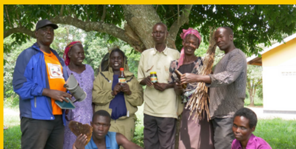
Afbeelding: 'Oogst de toekomst'