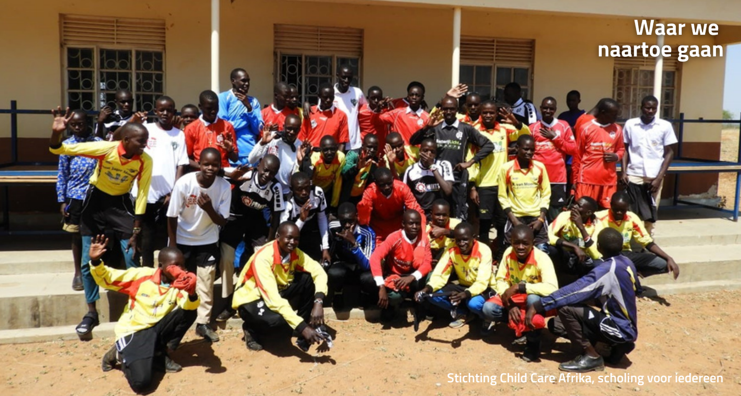
Stichting Child Care Afrika, scholing voor iedereen