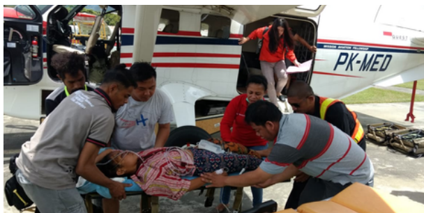
Afbeelding: MAF verzorgt een vlucht van een gewonde persoon

MAF Nederland vliegt voor meer dan 2.000 kerken en (hulp)organisaties met 130 MAF-vliegtuigen wereldwijd. MAF Nederland is gesponsord met € 10.000,- voor zonnecollectoren t.b.v. hun vestiging op vliegveld Teuge. De coördinatie vindt plaats door de Van Dorp vestiging Deventer.