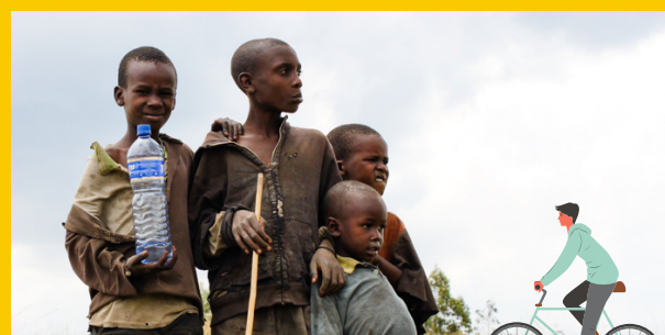
Afbeelding: Drinkwater voor Ethiopië

Er is een aanvraag binnengekomen in februari 2021 van een aantal ondernemers uit Benthuizen om een Elfstedentocht te fietsen t.b.v. de St. Woord en Daad voor een drinkwaterproject in Ethiopië. Er is een bedrag van €250,- toegezegd.