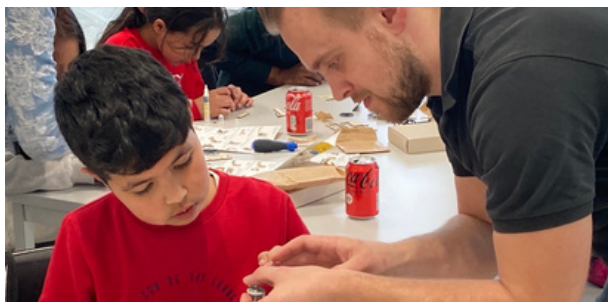
Afbeelding: Van Dorp medewerker helpt een leerling van de Weekendschool

Stichting IMC Weekendschool verzorgt aanvullend, motivatiegericht onderwijs voor jongeren vanaf tien jaar, op die plekken in Nederland waar dat het hardst nodig is. Zij zijn actief op 63 locaties door het land via de programma's IMC Weekendschool, IMC Basis, IMC on Tour en IMC Alumni. In juni 2021 is besloten dat Van Dorp installaties graag wil bijdragen aan het vak techniek. Daarbij hebben we in 2021 een aantal 'Weekendscholen' voor het IMC verzorgd. Leerlingen hebben een kleine les gekregen en in het praktijklokaal geknutseld aan technische projecten. Ook stond er een gave goodybag klaar aan het eind. Dit alles is bekostigd door Van Dorp foundation. Jongeren zijn de toekomst.